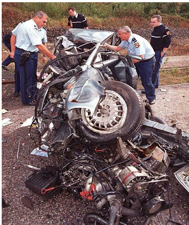
1 er janvier - 17 mai 2010 : 16 tués sur les routes des Vosges