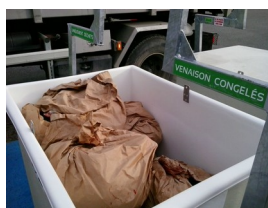
Exemple de point de collecte

Bilan actuel pour l'élimination des grosses quantités : dans plusieurs départements le système de bac est mis en place et fonctionne relativement bien (Côte d'Or notamment avec 24 points de collecte mis en place).