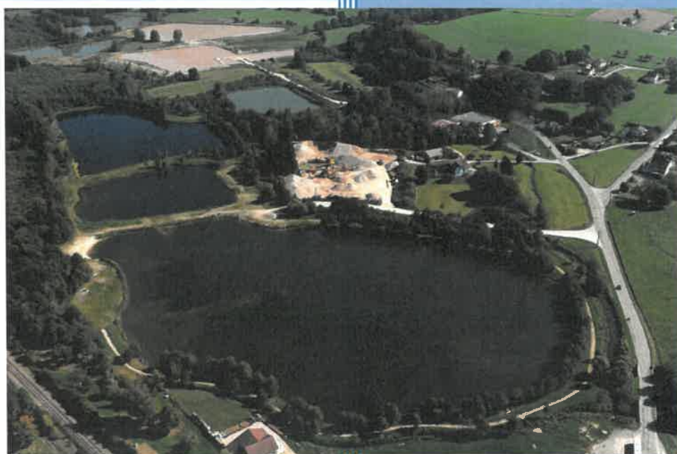
Gravière de La Chapelle-devant-Bruyères (88)