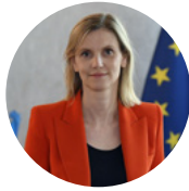
Agnès Pannier-Runacher, Ministre déléguée chargée de l'Industrie