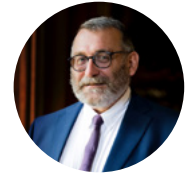
Joël Giraud, Secrétaire d'État chargé de la ruralité

Ce projet photographique souligne l'importance des activités industrielles dans les territoires que le train traverse et offre en paysage. C'est une magnifique vitrine des « territoires d'industrie » tels que les Vosges et le Nord Franche-Comté desservis par la Gare de l'Est, et Saint-Nazaire Cordemais, la Vallée de l'Huisne, et l'ensemble Lacq - Pau - Tarbes desservis par la Gare Montparnasse. Car le présent et l'avenir de l'industrie se jouent en grande partie dans nos territoires ruraux, dans nos petites et moyennes villes, je suis heureux qu'une exposition s'adonne à les valoriser. »