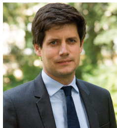
Julien Denormandie, ministre de l'Agriculture et de l'Alimentation

La crise de la Covid-19 a rappelé l'importance stratégique de notre agriculture. La mobilisation sans faille de l'ensemble de la chaîne agricole a permis de garantir à tous les Français, dans l'Hexagone et dans les Outre-mer, un accès à l'alimentation. Grâce aux efforts des femmes et des hommes de la ferme France, produire notre alimentation sur notre territoire est un atout pour assurer notre souveraineté alimentaire. Si la chaîne a tenu durant la crise, celle-ci a aussi révélé nos vulnérabilités à même de fragiliser notre indépendance alimentaire. Le paradoxe est connu : la France est la première puissance agricole en Europe mais nous dépendons encore de trop d'importations, par exemple en protéines. La priorité du plan de relance, et les moyens déployés sont à la hauteur, est la reconquête de cette indépendance .